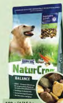
100 g/4/15 kg