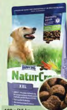
100 g/15 kg