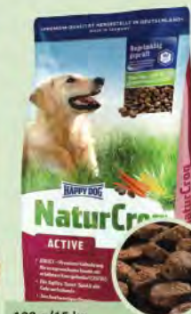
100 g/15 kg

Vyvážené, kompletní a lehe stravitelné Premium krmivo NaturCroq Welpen bylo vyvinuto pro speciální potravní nároky štěňat od 4. týdne do 12. měsíce. Plohadotné živočišné proteiny, zcela stravitelné domácí obilí, jakož i všechny důležité vitaminy, minerální látky a stopové prvky jsou nejlepší předpokladem zdravého vývoje Vašeho psa. Ostatně: znáte již Happy Dog Supreme 2 fázovou koncepci s redukcí proteinů pro optimální krmení po výměně zubů?