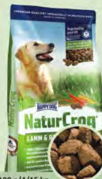
100 g/4/15 kg