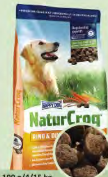
100 g/4/15 kg