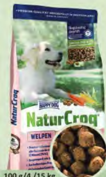
100 g/4 / 15 kg